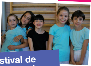
Festival de extraescolares