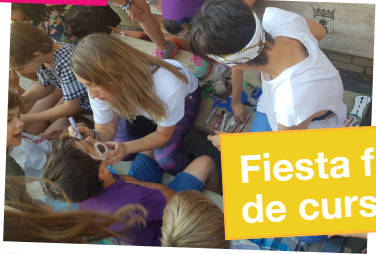
Fiesta fin de curso